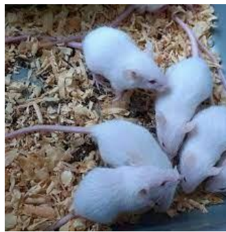
Gambar 2.2 Tikus Putih

Hewan coba merupakan hewan yang dikembang biakkan untuk digunakan sebagai hewan uji coba. Tikus sering digunakan pada berbagai macam penelitian medis selama bertahun-tahun. Hal ini dikarenakan tikus memiliki karakteristik genetik yang unik, mudah berkembang biak, murah serta mudah untuk mendapatkannya. Tikus merupakan hewan yang melakukan aktivitasnya pada malam hari (nocturnal) (Sundari 2022).